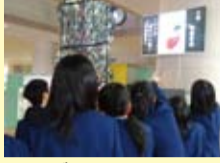
テレビモニター (七条中学校)