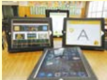
iPadを活用した教材 (洛友中学校)

下京中学校 バスケットボール部キャプテン(2年生) バスケットゴールをいただいて、昼休みにも使えるようになりました。部員だけでなく皆がバスケットボールを楽しめる環境ができたことがうれしいです。