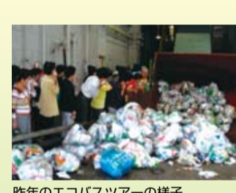
昨年のエコバスツアーの様子