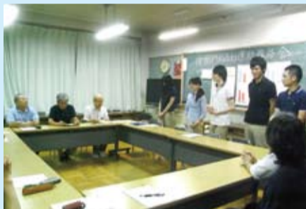
格致学区住民等による意見交換会

一緒に頑張って取り組んでいます。これまでの取組で、夜間の門灯調査や住民のアンケート調査の実施を通して、毎月10日を点灯(てんとつ)の日とする提案等がありました。今後は、住