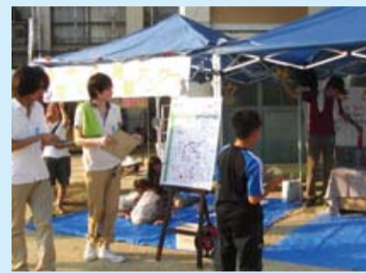
夏祭りでのアンケート調査を実施

区では、「下京歩歩塾」に続く基本計画「まずやること」第2弾として「安全で環境にやさしい夜間門灯点灯運動」に7月から着手しています。この事業は、各家庭に門灯の点灯をお願いし、夜間の通りを明るくして安全に通行してもらう運動で、住民の皆さんが地域課題を共有して一緒に解決し、地域ぐるみで取り組んでもらうものです。