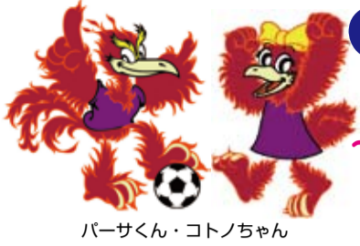
パーサクン・コトノちゃん