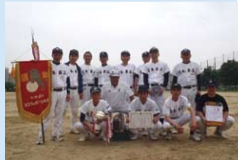
壮年の部優勝 七条第三体育振興会の皆さん

開催日 6月5日、12日 優勝 七条第三体育振興会 準優勝 淳風体育振興会 3位 醒泉体育振興会 3位 有隣体育振興会