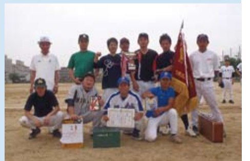
一般の部優勝 光徳体育振興会の皆さん

開催日 6月5日、12日 優勝 光徳体育振興会 準優勝 淳風体育振興会 3位 菊浜体育振興会 3位 七条第三体育振興会