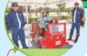
写真はすべて昨年の様子