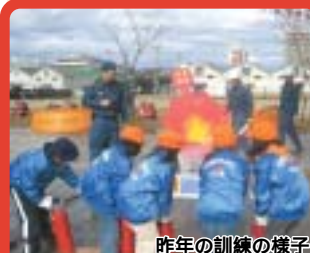
昨年の訓練の様子