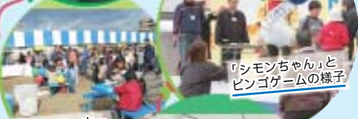
「シモンちゃん」とピンゴゲームの様子