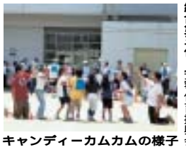
キャンディーカムカムの様子

以下は、平日の午前8時30分から午後5時の間にご連絡をお願いします。 下京区体育振興会 連合会主催 各種スポーツ大会結果 下京区民大運動会 総合優勝 尚徳体育振興会 総合準優勝 植柳体育振興会 総合第三位 安寧体育振興会