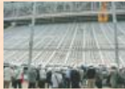
東本願寺 御影堂御修復現場