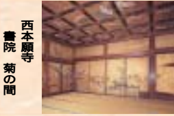
西本願寺 書院 菊の間