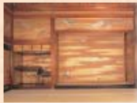
東本願寺 白書院 上段の間