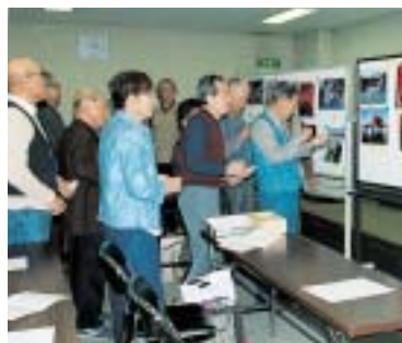
互いの作品を品評する会員ら

写真サークル「フォト楽友」では、例会や野外撮影会などの活動を行っています。月に1度開かれる例会では、各自が写真を2枚程度持ち寄り、会員同士でそれぞれの作品を品評し合った後、講師から指導を受けます。持ち寄る作品にテーマなどは設定せず、気楽に参加していただけることを目指しています。また、春と秋の年2回開催される野外撮影会では、撮影技術を磨くとともに、会員同士の交流を深めています。 初心者からベテランまで、写真に興味のある方は、ぜひお問い合わせください。 日時 毎月第3木曜日 午後1時30分～午後3時 場所 下京区総合庁舎 4階会議室 会費 月千円 ☎ まちづくり推進課(☎371・7170)