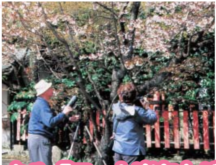
車折神社(右京区)での今春の野外撮影会の様子

「フォト楽友」では、15周年を記念してギャラリーを開催するとともに、新メンバーを募集します。