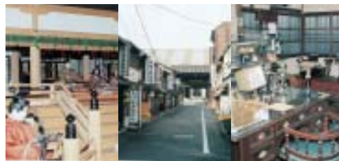
マップ「下京まちなみ散歩4」より