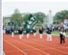
開会式での入場行進

さわやかな秋空の11月3日、西京極総合運動公園で第17回市民スポーツフェスティバルが開催されました。開会式では、約300人の区民の皆さんが堂々とした入場行進を披露し、7種目の競技に参加して大いに健闘されました。熱戦の末、次のチームが入賞しました。 △優勝 第52回 京都市ソフトボール大会 光徳学区 ソフトボール大会 植柳A 安寧 七条 西大路B ベタンク大会 植柳A 植柳B