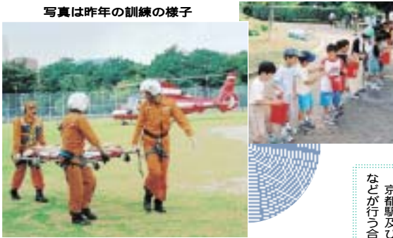
写真は昨年の訓練の様子

今年度は下京区全域で区民参加型の総合防災訓練を実施します。自分たちのまちは自分たちで守る、という防災の基本に立って、いざというときにあわてず適切な行動ができるよう、家族ぐるみ、地域ぐるみで訓練にご参加ください。