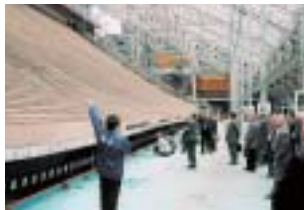
東本願寺 御影堂御修復現場