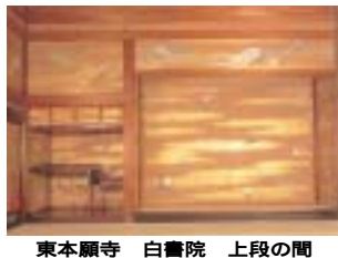
東本願寺 白書院 上段の間