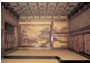
西本願寺 白書院 一の間

下京・町衆フォーラムでは、毎年多くの参加者でにぎわい、ご好評をいただいている「下京門前町ルネッサンス」を今年も9月11日(日)に開催します。