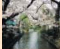
昨年度の 応募作品から テーマ 「下京の四季」