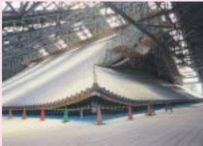
西本願寺 御影堂修復現場