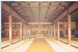
西本願寺書院 鴻の間