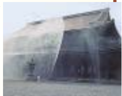
東本願寺 放水訓練