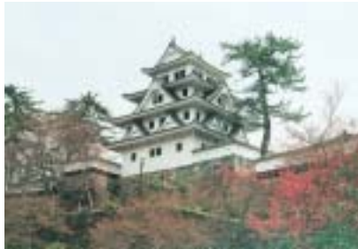
郡上八幡城 天守閣

わがまち下京区を再認識し、これからのまちづくりに生かすための、歴史と文化に富んだ魅力あるまちを訪ねる「下京区歴史探訪の会」の参加者を募集します。 今年3月、豊富で良質な地下水に恵まれた京都の地を中心に、第3回世界水フォーラムが開催されました。そこで今回は、水にゆかりの深いまち「郡上八幡」を訪ねます。「奥美濃の小京都」と言われ、名水百選にも指定された宗祇水が、今もこんこんと湧いている。水とおどりの城下町の歴史と文化に触れてみませんか。 日時 6月11日(水) 午前8時出発 費用 6千円(昼食含む) 定員 80人 申込み方法 往復はがきに、住所・氏名・電話番号を記入して申込み。1枚で2人まで申込みます。 返信用はがきにも、住所・氏名を記入しておいてください。 あて先 〒600-8588 下京区役所地域振興課 歴史探訪係 締切り 5月23日(金)到着分まで有効とし、申込み多数のときは抽選。 その他 当選者は、参加費を5月30日(金)までに地域振興課へ持参。