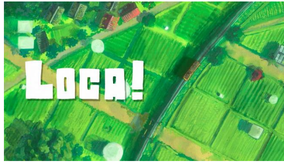
デジタルアニメコンテスト 最優秀賞『Loca!』