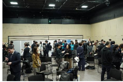
【昨年度の授賞式・交流会の様子】