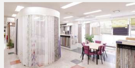
株式会社ツカサ ショールーム

このプログラムでは、企業の見学やインテリアパネルづくりを体験し、先輩社員とお話できます。