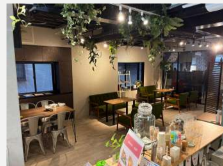
株式会社クレバー アトリエボックス