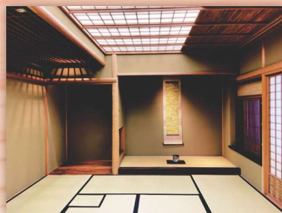
北山丸太で彩る茶室の展示イメージ