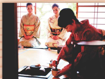
茶道お点前の実演イメージ