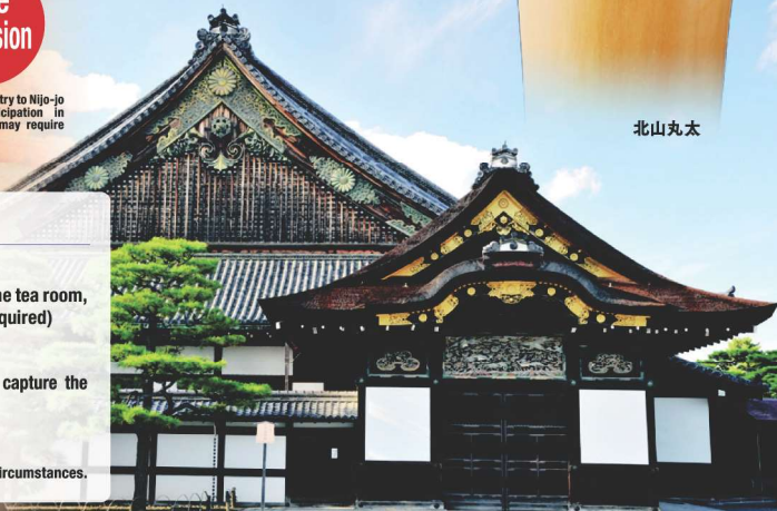
元離宮二条城 二の丸御殿

*Details may change depending on circumstances.