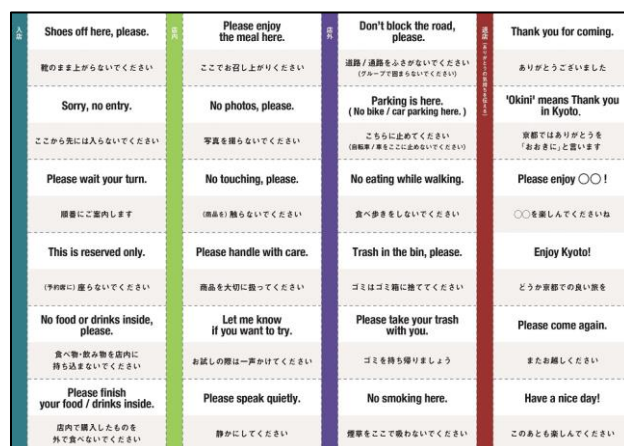
裏面（マナー啓発フレーズを記載）

デザイン・構成やフレーズについては、昨年秋に、市内の飲食店や小売店、観光施設に御協力いただき、試作品を実際に使用いただいたり、ヒアリングを行ったうえで、検討・選定しました。