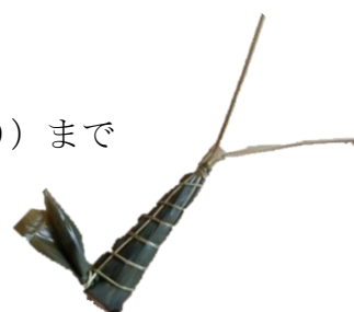
花脊別所の笹で作った「ちまき」