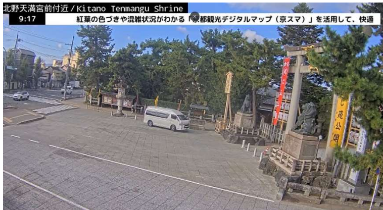
配信イメージ例（北野天満宮ライブカメラ）