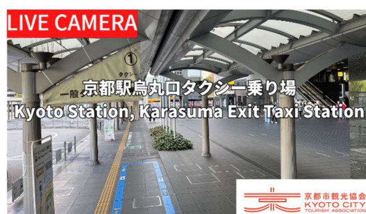
京都駅烏丸口タクシー乗り場