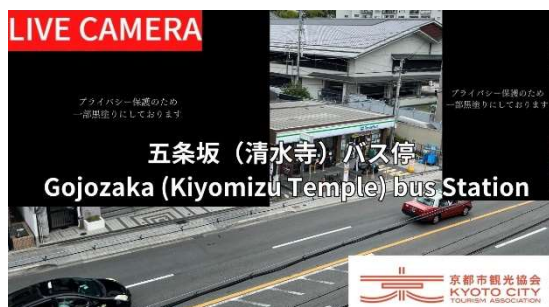
五条坂バス停留所

※ 個人情報保護の観点を踏まえ、黒塗りや解像度を落として放映するとともに、録画は行いません。