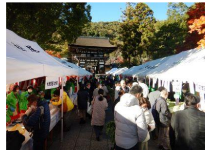
野菜等の即売と飲食提供