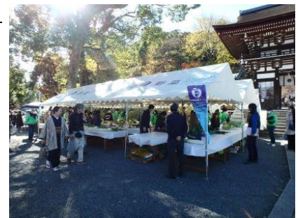
農産物品評会会場