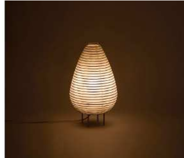
提灯の技術を使った ランプ