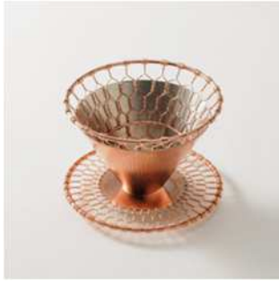
京金網の技術を使った コーヒードリッパー

京都市の伝統的な技術及び技法を用いた、現代のライフスタイルに適した伝統産業品を 展示し、本イベントならではの特別な展示空間を演出します。