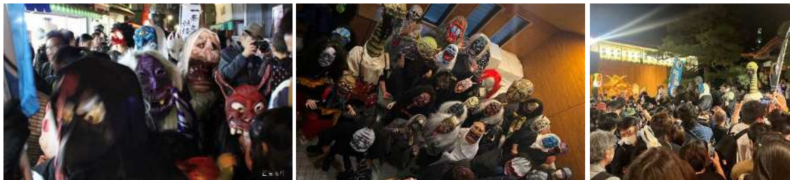
※過去開催時の様子