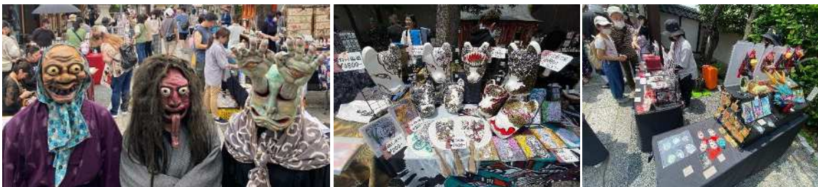
※過去開催時の様子