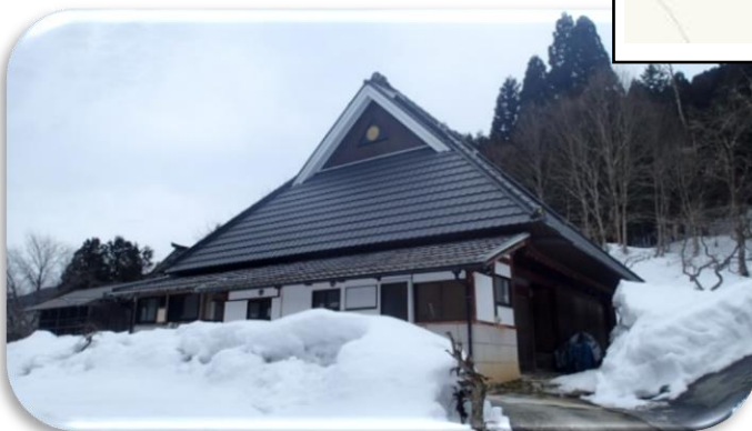
農家民宿一例 (下記URL もぜひ見てね!)