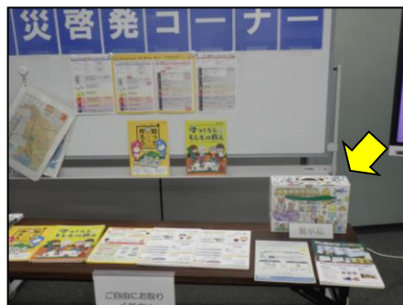
区役所内での展示の様子(左写真:左京区役所 右写真:伏見区役所)