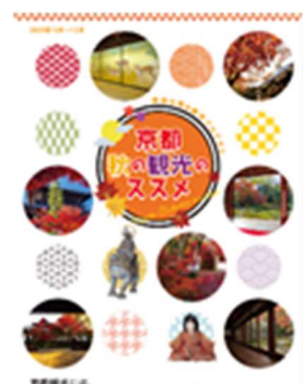
「京都 秋の観光のススメ」表紙

https://www.city.kyoto.lg.jp/sankan/page/0000317969.html