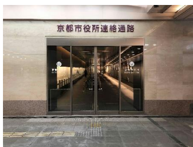
ゼスト御池から地下連絡通路への入り口