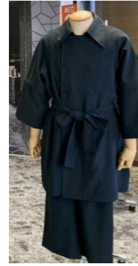
京都ゾーンアテンダント ユニフォーム