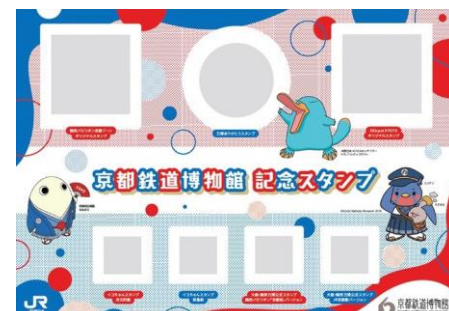
▲スタンプ用紙(イメージ)