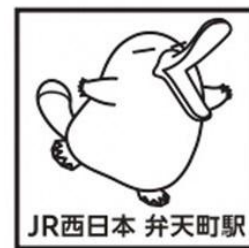
▲イコちゃんスタンプ