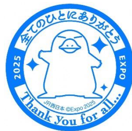
▲万博ありがとうスタンプ

※お客様ご自身でスタンプ帳をお持ちの場合、スタンプ用紙かスタンプ帳のどちらかのみでお願いします。