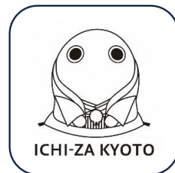
▲大阪・関西万博公式 スタンプ 関西パビリオン京都府 ver