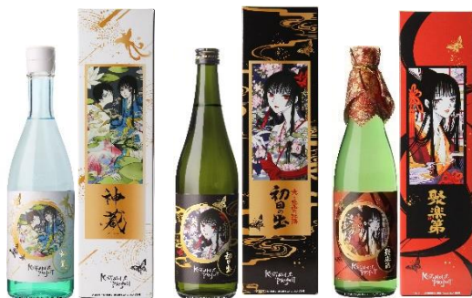
商品一例 (開発中のため、現物とは異なる可能性があります。)