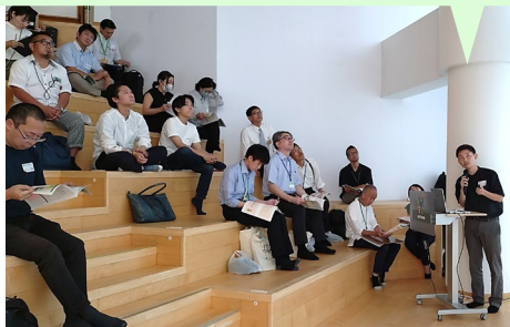
3-2 “京野菜からはじまる地産地消プロジェクト” 紹介