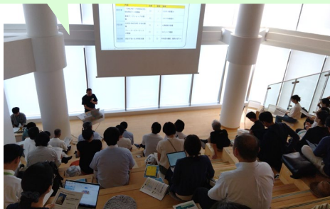
3-1 “みんなで京都市の農家を応援するプロジェクト” 紹介