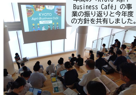
2. これまでの振り返り、R6年度の方針

令和6年度に実施する3プロジェクトについて、それぞれ紹介者より発表！参加者からは「ぜひ勉強会に参加したい！」「自社のこんな事業で協力できるかも？」「こんなテーマで交流したい！」等多くのアイデア・意見をいただきました。