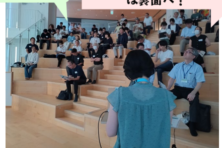
3-3 “みんなで耕す「京都市アグリビジネスカフェ」プロジェクト” 紹介

発表者、会場の参加者みんなで意見交換。「持続して続けていくには？」などの問いから議論が深まりました。