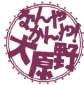
京都・西山「大原野」ブランドロゴマーク