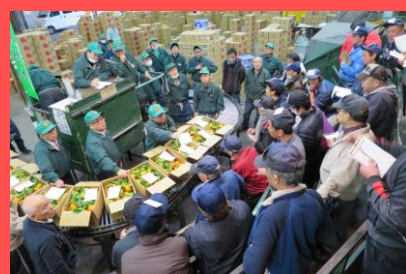
せりの様子（葉付橙）

※ 過去の季節商材の初入荷やせりの様子は、 京都市情報館 旬だより のページでご覧いただけます。 http://www.city.kyoto.lg.jp/menu2/category/33-6-0-0-0-0-0-0-0-0-0.html