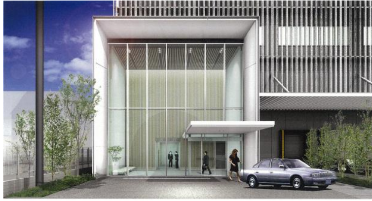
青果配送加工センター入口