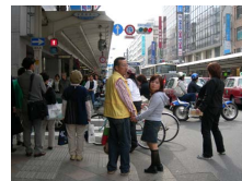
従来の四条通の状況

四条通では、歩道を現状の約2倍に広げ、路線バスとタクシーのみ通行可とする トランジットモールを実施 ○子供と手を繋いで一緒に歩ける空間 を創出