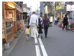
社会実験時の細街路の状況