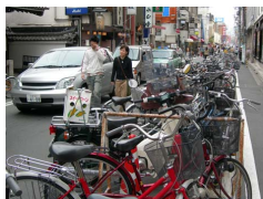
従来の細街路の状況

細街路では、通過交通の迂回誘導や放置自転車の臨時駐輪場への誘導等により、 ○友人や家族と一緒に、ゆったりと笑顔で歩ける空間 を創出