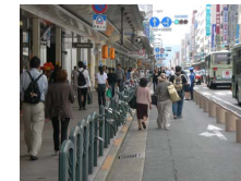
社会実験時の四条通の状況