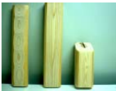
北山丸太面皮柱サンプル