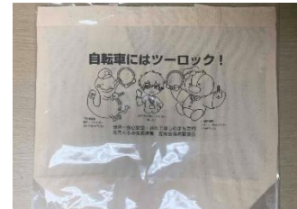
啓発用エコバッグ