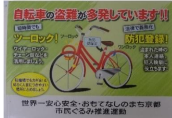
啓発用ポケットティッシュ