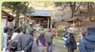
昨年の活動の様子

【申請方法】申請期間に、メール、郵送又は持参にて下記問合せ先へ申請書類をご提出ください。 ※募集要項等の詳細は二次元コードから。 ※初めて申請される場合、要事前相談。