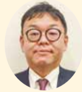
左京区長 大江 明生

【問合せ】地域力推進室左京の魅力づくり推進担当 (TEL075-702-1021、FAX075-702-1301、メールsakyo@city.kyoto.lg.jp)