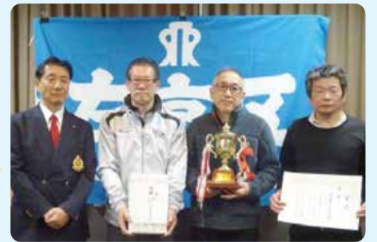
明德体育振興会チームの皆さん