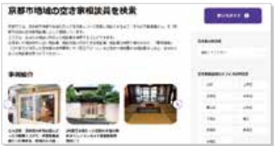
相談員検索ページ