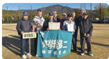
修学院第二体育振興会 Aチームの皆さん

【11月23日】 ～第30回左京区民 グラウンドゴルフ大会結果～ 優勝：修学院第二体育振興会Aチーム 準優勝：養徳体育振興会チーム 第3位：岩倉南体育振興会Aチーム