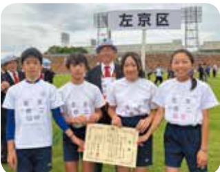
修学院第二体育振興会チーム の皆さん

【11月17日】 ～第36回 市民スポーツフェスティバル結果～ 左京区：総合8位 【小学生男女混合400mリレー】 修学院第二体育振興会：4位 タイム：58.17秒 【グラウンド・ゴルフ大会】 下鴨体育振興会：6位