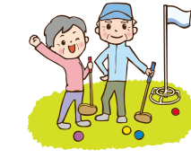
上高野体育振興会チーム の皆さん