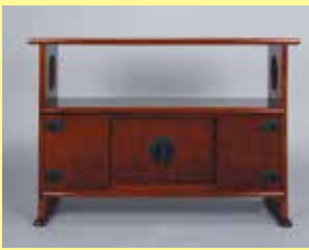
黒田辰秋 《拭漆文欄木飾棚》 1966年 京都国立近代美術館

会場・問合せ 京都国立近代美術館(岡崎円勝寺町26-1 TEL075-761-4111)