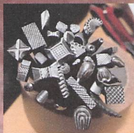
一つの作品を仕上げます