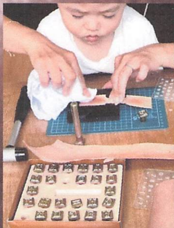
イニシャルなどを刻印