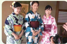
8月に実施した留学生の浴衣撮影会