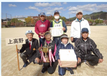
上高野体育振興会チームの皆さん