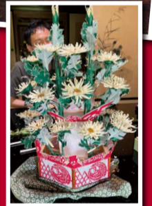
踊りに使用する花笠