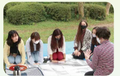
取材先の府立植物園で、野点を行いました。