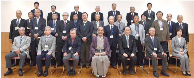
※写真撮影時のみマスクを外しています

先立って開催した区長懇談会では、社会問題化しつつある空き家の問題点や空き家が発生する原因等を学ぶ「住まいの将来を考える おしかけ講座」を開催し、地域で空き家問題を考えていただく一助としました。