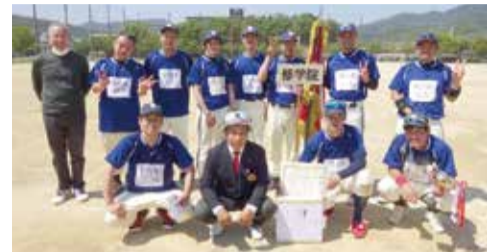
修学院体育振興会チーム