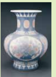
重要文化財 《葆光彩磁珍果花瓶》 1917(大正6)年 泉屋博物館東京

期間 9月3日(土)~10月23日(日) 時間 10:00~17:00 休館日 月曜日(9月19日(月)、10月10日(月)は開館)、9月20日(火)、10月11日(火) 観覧料 一般 1,000円(予定) 会場 泉屋博物館(鹿ヶ谷下宮ノ前町24 ☎771-6411)