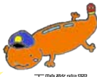
下鴨警察署 防犯キャラクター ぱとさんしょううお

ちょっとまって! 還付金の手続きはATMでできないよ この電話は間違いなく詐欺!!