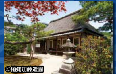
岩倉具視幽棲旧宅

スタンプラリー 12月10日(金)~令和4年2月13日(日) 京都市歴史資料館と岩倉具視幽棲旧宅(岩倉上蔵町100 ☎781-7984)の両施設に入館しスタンプを集めると、岩倉公ゆかりの手拭(京都精華大学生によるオリジナルデザイン)を抽選で80名様にプレゼントします。 詳細は、特設サイトへ。