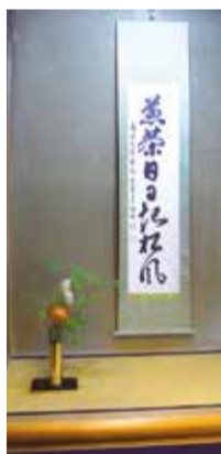
稽古の時も掛け軸やお花が飾られています。

茶席では、小さい器に入れるため、たくさん飲むことはできませんが、味と香りが凝縮されたお茶になっています。海外で茶席を催した際には、「少なすぎる」と注2 水屋までお代わりを求めて来られたこともあり、「このお茶は喉の渇きを潤すのではなく、心の渇きを潤すのです。」と説明したこともありました。