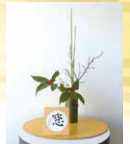
華道「未生流笹岡」監修

問合せ 区地域力推進室まちづくり推進担当 (☎702-1029、FAX702-1303、メール sakyo@city.kyoto.lg.jp)