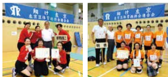
修学院第二体振チーム