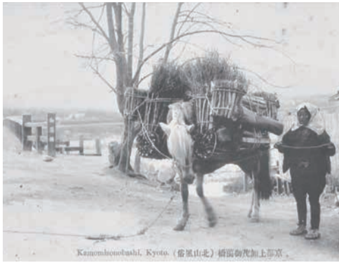
背に薪を載せた馬を牽く女性。上賀茂の御園橋東詰。明治45年(1912)以前に撮影。

若狭から京都へ至る街道は多数ありましたが、そのうちの大原を通る若狭街道と鞍馬を通る若狭街道を使って運ばれた物のうち、最も重要であったのは、1950年代前半まで、炭と柴でした。統計がなかった村もあるので、正確ではないのですが、『京都府地誌』(1881年頃)の時代でも『愛宕郡村志』(1911年)の時代でも、鞍馬を通る道に沿った村の炭と柴は、大原を通る道に沿った村のそれらの数倍あったようです。