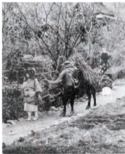
背に薪を載せた牛を牽き、自らは薪を一束頭上にいただいている小原女(八瀬の女性)。大正7年(1918)4月1日～昭和8年(1933)2月14日。

鞍馬あるいは大原まで炭を人力・畜力で運んで売ったのですが、炭の運び先が鞍馬であることが多かったからです。大原と京都間の道は狭いので、大原と京都間の道は狭く、そこでは牛馬がすれ違うことも困難でしたが、鞍馬と京都間はそれより道幅が広く、牛馬がすれ違うことができました。鞍馬と京都間の岩倉、松ヶ崎、上賀茂、下鴨、紫竹などの村人が、農間に牛馬を連れて鞍馬へ行き、炭を牛馬の背に載せて京都まで運び、鞍馬と京都間の流通が確立されていたからでしょう。