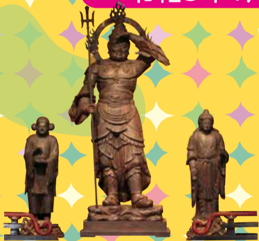
国宝 毘沙門天三尊立像(鞍馬寺)