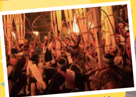
鞍馬火祭(今年度は中止)