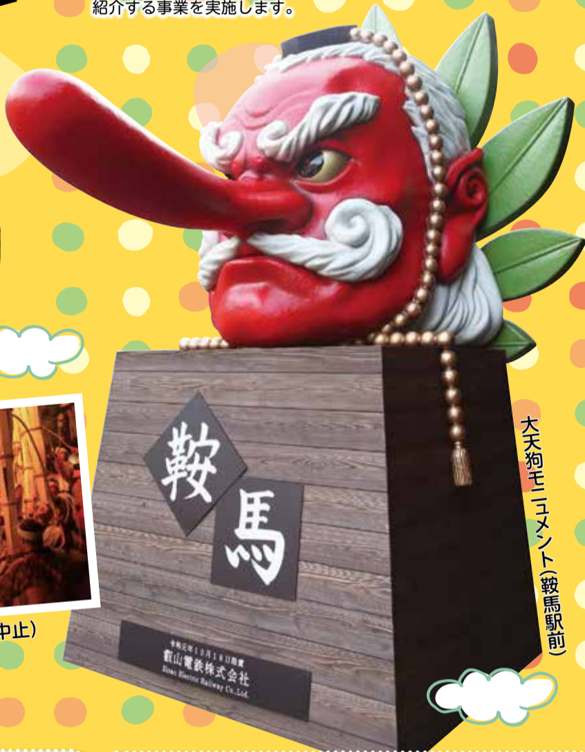
大天狗モニュメント(鞍馬駅前)