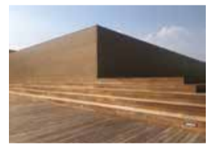
京都市京セラ美術館

リニューアルオープンした京都市京セラ美術館はそんな思いが込められたポイントがいっぱいあります。例えば「ガラス・リボン」と呼ばれるエントランス。開かれた美術館を目指してリニューアルオープンした京都市京セラ美術館のエントランスは地上から緩やかな下り坂に続く形になっていて、周辺を散歩しながら気づいたら美術館にたどり着いているといった構造になっています。改めて足を運ぶ場所といったイメージを覆す素敵な入口だと思います。また、今回のリニューアルで大切にさ